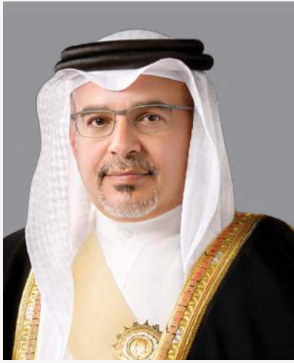
صاحب السمو الملكي الأمير سلمان بن حمد آل خليفة ولي العهد رئيس الوزراء