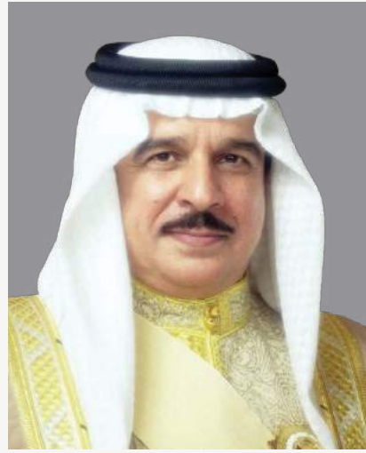
حضرة صاحب الجلالة الملك حمد بن عيسى آل خليفة ملك مملكة البحرين المفدى